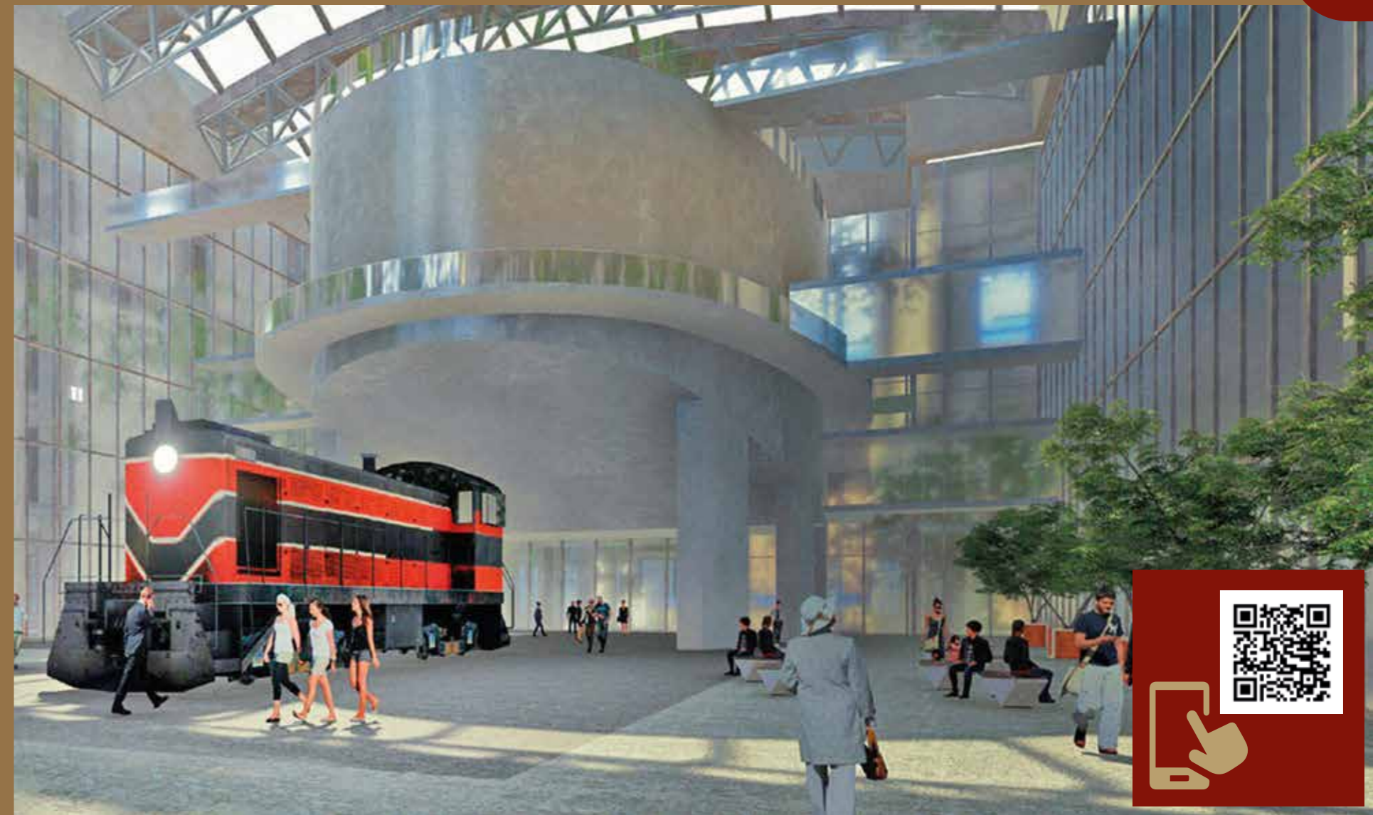
Проект конгрессно-выставочного центра Российского университета транспорта. Планируемый срок ввода – 2026 год