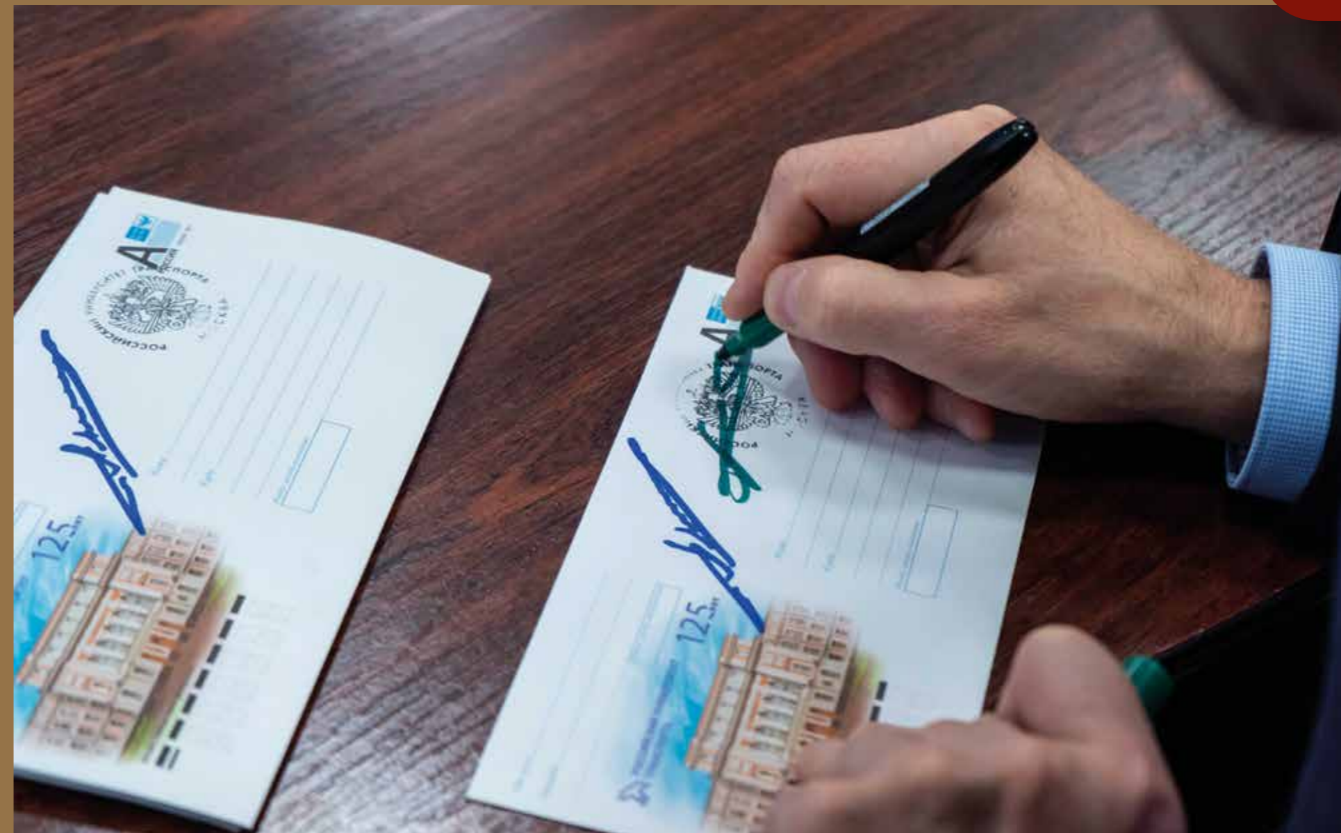
Тираж конверта составляет один миллион экземпляров